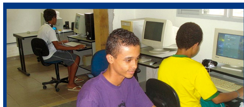
ALUNOS DO CURSO DE INFORMÁTICA DO SINDSERV/COSTA NORTE: 2ª a 5ª - Cursos das 12h às 20h - Interessados devem procurar à Secretária da Filial do Sindserv na Enseada (Costa Norte)